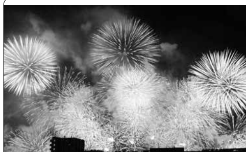
表紙の写真：びわ湖大花火大会