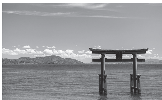
表紙の写真：白髭神社の湖中鳥居

白髭神社は、日本遺産に認定されている近江最古の大社であり "近江の厳島" とも呼ばれています。